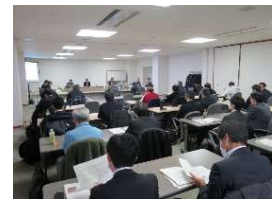
昨年度のディスカッション