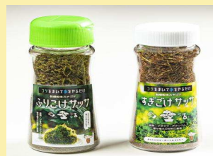
ふりこけサッサ すぎごけサッサ

原料となるスナゴケ、スギゴケ等を地産化するため、各種成長促進剤ごとに効果を検証しながら、苔を短期間で成長させる「繁殖サイクル技術」を開発しました。