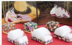
越前和紙「友禅柄」をプリントさせたキューブメモの開発

「嶺南新産業創出モデル補助事業」の実用化研究枠により開発した越前和紙「友禅柄」をプリントさせたキューブメモを、販路開拓枠(旧エネルギー研究成果等販路開拓支援事業)によりネットモールを開設し、新ブランド「越前和紙十五夜」を立ち上げ販路開拓を図り、売上拡大につなげました。