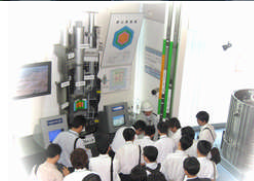
「もんじゅ」の縮小炉心模型にて