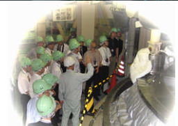
「もんじゅ」の ISI 装置開発用原子炉容器実物大モデルにて

この日韓学生交流事業は、来年度以降、中国原子力学会とも連携し、日中韓3国で行なわれることになっており、今回その先駆けとして、中国の清華大学、ハルビン工程大学から多数の参加者がありました。