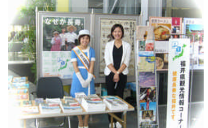
福井県の観光案内ブースも設置され、福井県越前・若狭の観光宣伝隊も応援に来所しました。