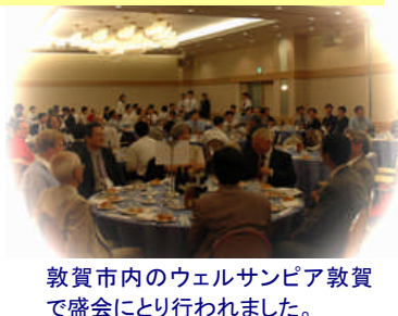
敦賀市内のウェルサンピア敦賀で盛会にとり行われました。