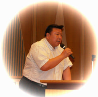
来賓挨拶をする 河瀬一治敦賀市長