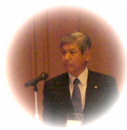
電気事業者の取り組みを紹介する 森本浩志名誉大会長(関西電力副社長)