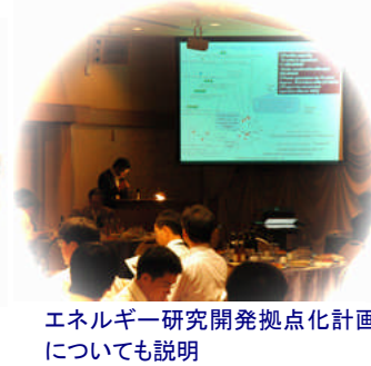
エネルギー研究開発拠点化計画についても説明