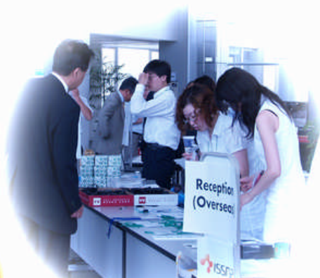
3日間を忙しく勤められた事務局の方々