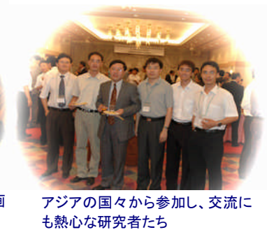
アジアの国々から参加し、交流にも熱心な研究者たち