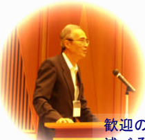
歓迎の挨拶を述べるエネ研の新宮所長

研究分野は、人間・社会・環境への親和性の高い原子力システムを目指す先端計測技術、システムシミュレーション技術、ヒューマンインターフェース技術などです。