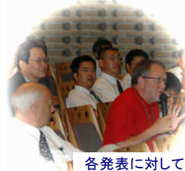
各発表に対して、真剣な議論や意見交換が行われました。