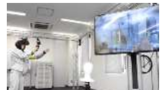
仮想体験実習のイメージ

複合現実感(MR)システムを利用し、廃止措置工事の仮想体験を実習します(定員10名)