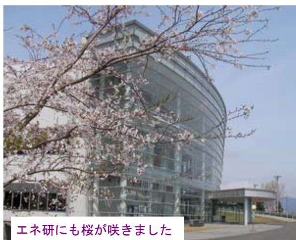
エネ研にも桜が咲きました