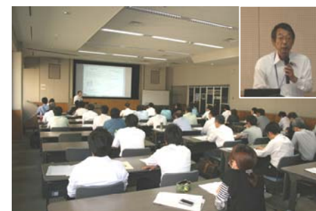
安田企画支援広報部長 開会挨拶

講習会終了後は、若狭湾エネルギー研究センターに設置されている表面分析機器の見学会を行い、「装置の操作方法」等に関するより具体的な質疑が交わされました。