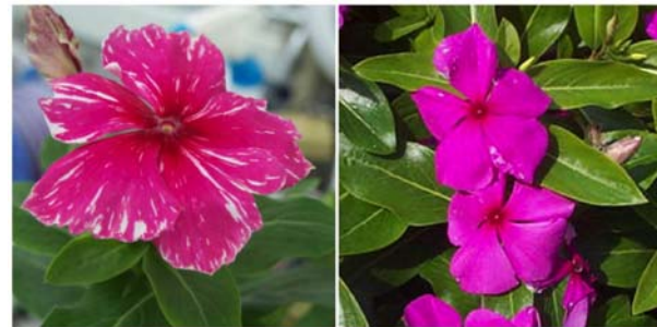
イオンビームによって作り出されたニチニチソウ 左の写真は、イオンビーム照射によって花に斑(ふ)の入ったニチニチソウ(右は一般的なニチニチソウ)

イオンビームは、 \gamma 線やX線よりも高い頻度で突然変異を引き起こすことができ、 \gamma 線やX線では起こりにくい突然変異をより高頻度で引き起こすことができることが分かって来ました。しかし、なぜそのような効果が生じるのかは未だによくわかっていません。