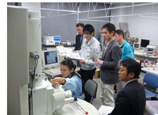
H22年度実技研修風景(FE-SEM)